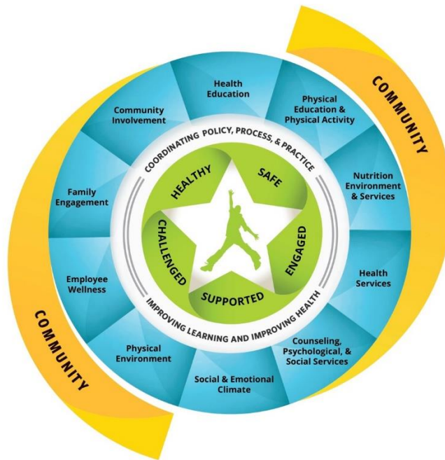
Gambar 2 Komponen Teori Model WSCC

Artikel jurnal yang dirancang oleh Schwartz dkk. (2023) dengan judul “ Expanding school wellness policies to encompass the Whole School, Whole Community, Whole Child model ” membahas mengenai peran penting kebijakan kesehatan sekolah dan keselarasannya dengan teori model WSCC. Schwartz dkk. (2023) menggarisbawahi lingkungan sekolah sebagai platform yang kuat untuk mendorong perilaku yang mendukung perkembangan siswa, menekankan perlunya pendekatan “ whole child ” yang sistematis dalam kebijakan kesehatan sekolah untuk menangani dimensi kesejahteraan yang beragam secara efektif.